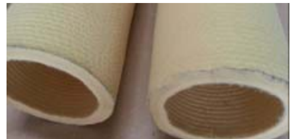
內層波浪紋路 (增強摩擦力)