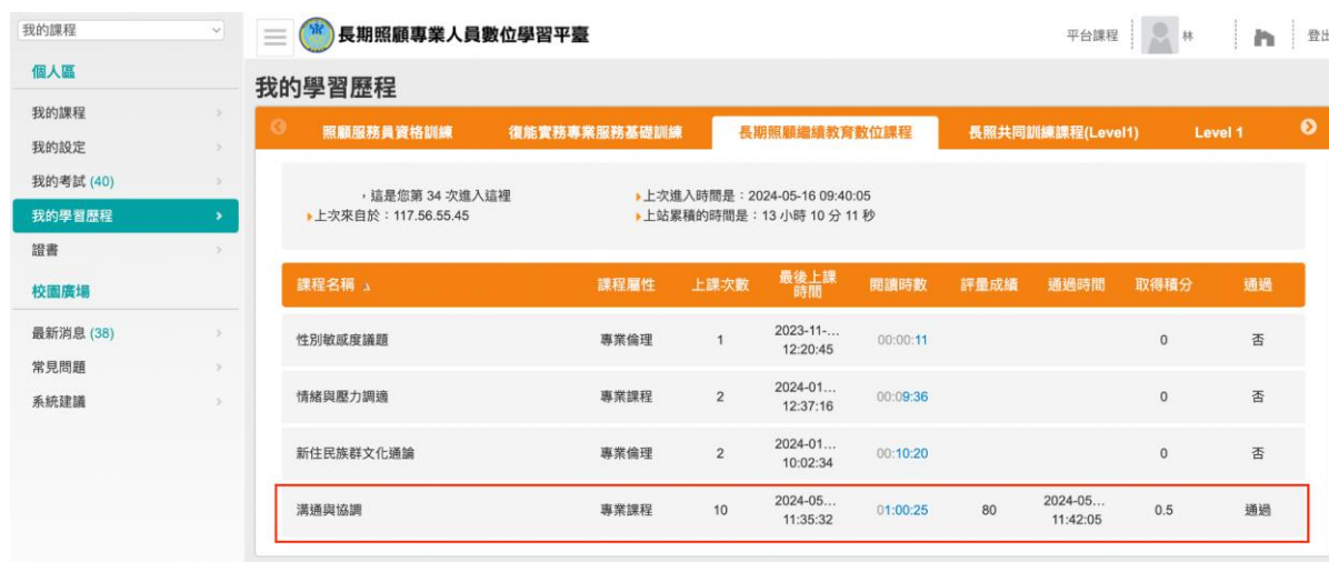
圖 1 長期照顧專業人員數位學習平台積分通過畫面