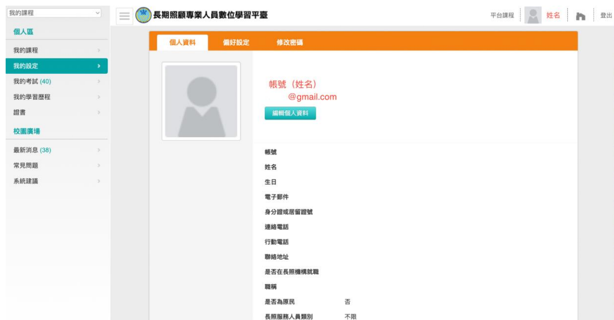
圖 2 長期照顧專業人員數位學習平台個人資料畫面