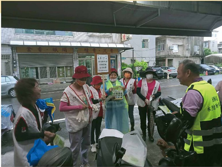
▲ 理事長帶領志工前往社區登革熱宣導