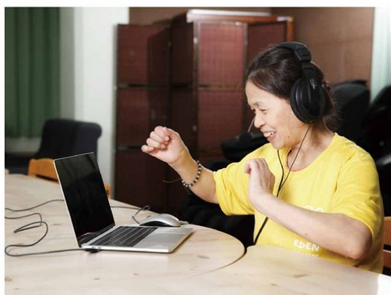
▲ 雲志工與服務對象交流互動

2020年起新冠肺炎在台灣爆發後，伊甸志工發展處為保護志工及會內服務使用者曾兩次宣布暫停志工服務，志工無法進到單位協助同工，也無法進到單位陪伴服務使用者。為解決如此困境並銜接後疫情時代趨勢，志工招訓中心至2020年7月起運用視訊軟體推出「雲志工專案」，讓志工透過視訊軟體與會內服務使用者聊天互動。