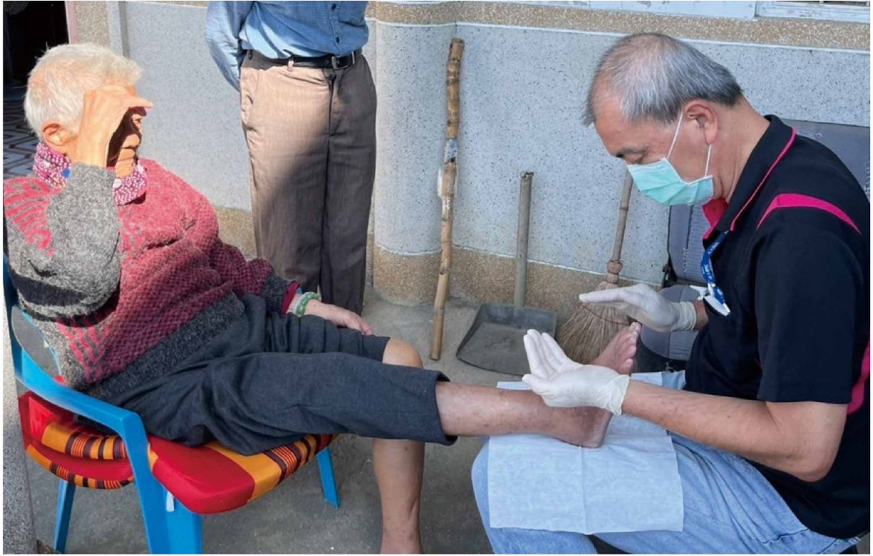
▲ 緣恩組(安寧病房)志工與居家護理師出訪個案家，協助病人修剪指甲