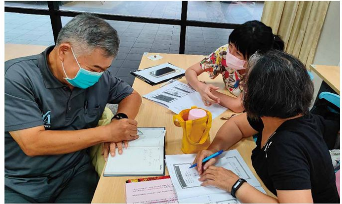
▲ 參與臺南市志願服務推廣中心舉辦112年度志工領導訓練

隨著社會的進步，人口逐漸高齡化，在鄉下地區更為嚴重，加上年輕人出外就業等因素。使得65歲以上的長輩們缺乏關懷與照顧，衍生了不少的問題與憾事，需要重視解決。因緣際會，來到小新社區關懷據點擔任志工，為長輩們服務。據點有20多位志工與50多位常出現的長輩們。在大家同心協力之下，辦理各項活動與課程，並結合衛福部、教育部、社會局、區公所、衛生所、各級學校與民間公司團體等單位資源，辦理餐飲服務／健康促進活動／電話問安／到府訪視等項目，並另進行許多細項活動。例如：爭取到教育部樂齡計畫，計5項40小時課程；衛生所延緩失智失能課程，計12堂24小時；臺灣集保公司補助經費新台幣13萬元，辦理長輩資訊通識、環保、手工花藝、老照片展覽等項目。