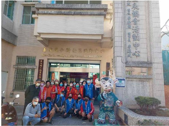
▲ 臺南市善化區小新社區志工隊