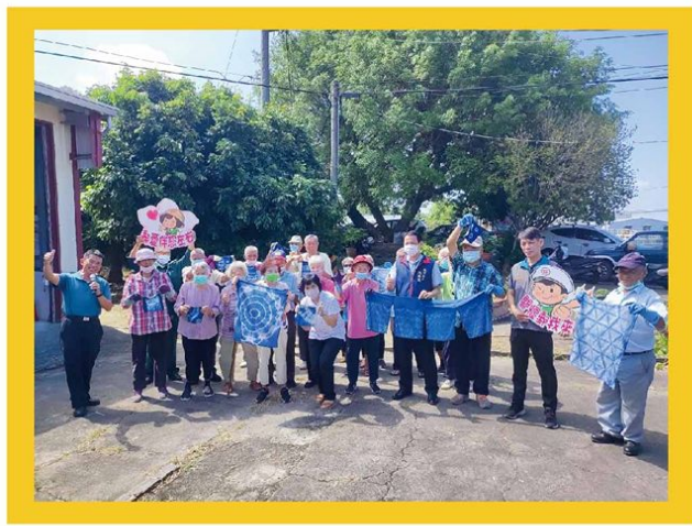
▲ 民眾展示DIY藍染的作品

中華郵政股份有限公司臺南郵局長期以來，善盡社會企業責任，鼓勵員工投入志願服務行列，員工在假日之餘也投入獨居老人關懷服務活動。臺南郵局長年於各地區捐贈廟麵、沐浴禮盒、燕麥奶及牙膏等民生物資予贈予本市各社福團體發給獨居弱勢老人。除了捐贈物資之外，臺南郵局也攜手台灣郵政協會及龍崎永續發展協會辦理藍色染布DIY的體驗活動供大家同樂。