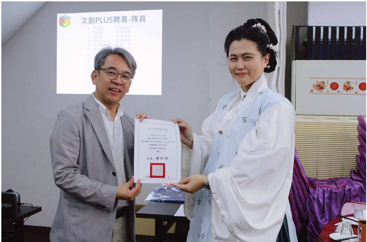
▲ 112志工文化局局長頒獎