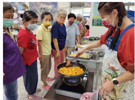
▲營養師教導民眾如何料理健康飲食

永康區西灣社區發展協會積極推廣和研發社區活動，善用各項社區資源，促成各項社區服務。在這個社區中，居民不僅是居民，更是創造者。大家共同參與社區的建設和管理，共同打造這個美麗的社區，實現成為「幸福社區」的願景。