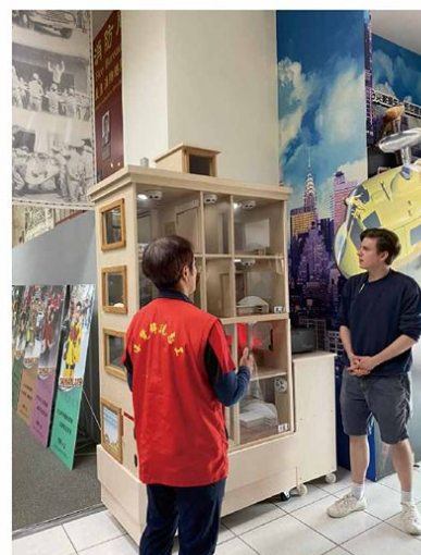
▲雙語導覽志工為美籍遊客導覽

臺南市防災教育館及消防史料館為擴大服務族群至外籍人士了解防火防災知識，於今(112)年向國家發展委員會爭取經費，辦理雙語導覽志工培訓課程、拍攝雙語導覽影片、製作雙語摺頁與雙語解說板，期望提升館內的服務品質並融入雙語元素。此次計畫共辦理3次雙語導覽解說志工訓練，訓練過程志工參與踴躍、學習認真，充實自我內涵與成長，相信大大提升導覽解說品質。