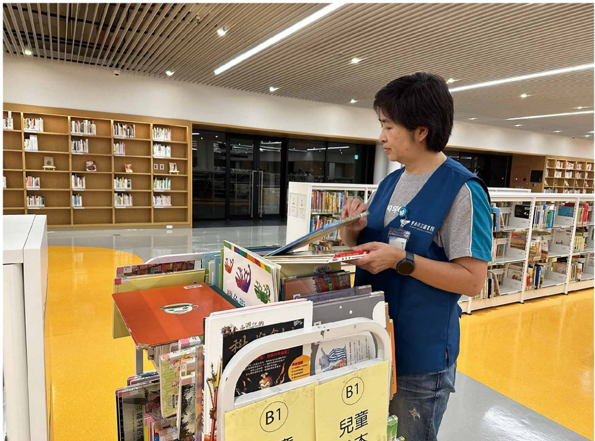
▲ 將民眾未歸還的書分類整理

上架整架的志工通常是無聲的一群，我們默默地推著書車、靜靜地將圖書上架、仔細地檢查架上的圖書是否依照索書號陳列，讓系統上顯示在架的圖書都能被擺放在正確的位置，避免讀者循著索書號而來卻遍尋不著。所以，「細心」、「專注」是上架整架志工的基本標配。圖書組的志工還擁有一項「超能力」，腦袋裡隨時置入一張館藏位置圖。永康新總館有四十萬冊藏書，每回值勤總會有讀者拿著手機app顯示的索書號詢問典藏處，志工們均能迅速回應並且將讀者帶往該書架，每一句道謝與讚嘆，都能滿足我們小小的成就感。