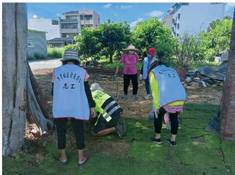
▲志工協助綠美化鋪植草皮，成為社區休息點

西灣社區於今年4月7日成立了西灣祥和志工隊，雖然成立時間不久，但已經獲得衛生福利部112年度社區發展工作金卓越社區選拔甲等獎的榮譽。西灣社區在各個領域都不斷努力並取得了優秀的成果。他們的服務對象除了老人、小孩和婦女之外，對於社區營造及文化教育都有詳細的規劃。