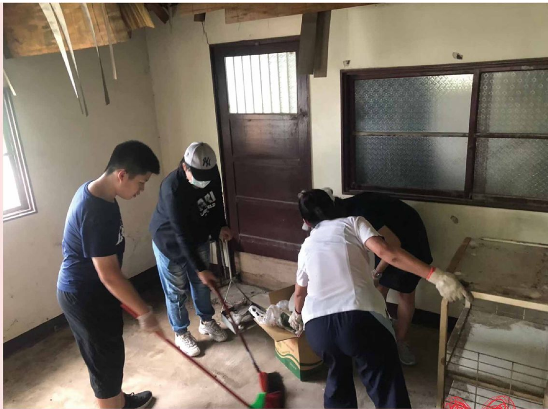
▲志工協助獨居長整理屋內環境

一行人浩浩蕩蕩上山，幫一位88歲獨居阿公進行簡易防水工程，我們幫他屋頂蓋上帆布，讓屋內不再漏水；幫他整理環境，讓屋內更乾淨、更適合走動；也在他每天攀爬的陡坡安裝上扶手。我忘記共去了幾趟，一次次造訪，阿公原本深鎖的眉頭，鬆開了；原本糾結的嘴角，微笑了。有一次，他用明亮的眼神看著我們，拉著我們坐下，突然開始分享他早年的生活，甚至唱起他還記得的日文歌給大家聽。「有閒來坐啦！」阿公邀請我們常去坐坐，也邀請我們在屋旁的土坡炕窯，並分享自己種植的蔬菜給我們。對於阿公明顯改變，大家都感到欣慰，他一輩子所求不多，三餐溫飽、一個遮風避雨之所、偶爾有人關心，如此而已。