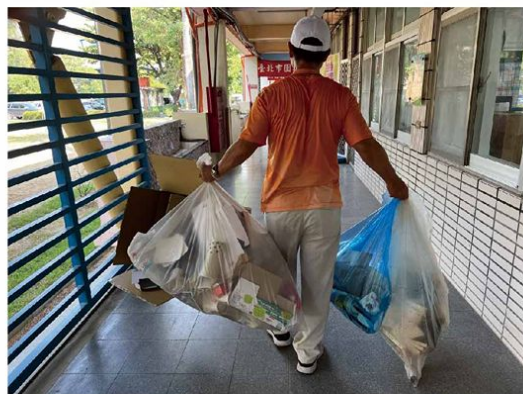
▲於進學國小協助環保清潔工作

在112年1月15日這一日，我的公務生涯做好做滿，劃下了完美的句點，光榮地退休了。退休後第一件事主動向所居住的新營區新南里社區環保志工隊報到，一起守護家園共同清理社區環境，盡到社區一份子的責任，每個月環境清潔日與志工夥伴們拿起掃帚或垃圾袋，沿著社區綠蔭大道將垃圾、落葉、菸蒂、狗便便等清理乾淨，結束後將當日清掃心得或志工們有趣對話，上傳個人臉書(fb)及志工群組分享。