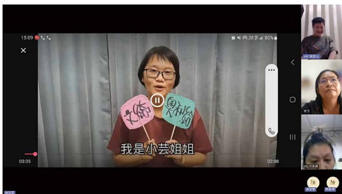
▲► 雲志工與服務對象交流互動

服務的方式讓志工可以多方面認識不同的服務使用者，而讓服務使用者也能多方互動及學習，相信藉此服務能讓許多人看到服務使用者們可愛的笑容及互動。