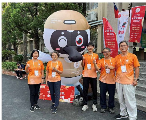
▲於全國運動會擔任環保志工