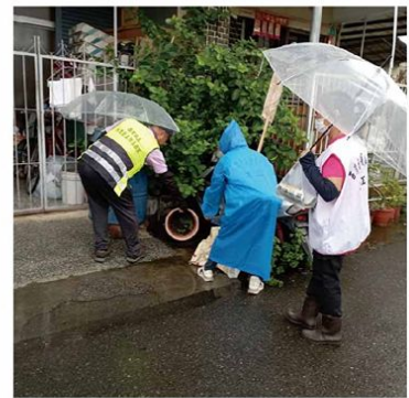
▲ 志工於社區進行滋清

今年本土登革熱疫情嚴峻，臺南成為流行區，臺南市政府上上下下動員市府各局處、區公所、衛生所、國軍、國營事業及相關單位，全面整合市府資源，共同對抗登革熱，為杜絕病媒蚊孳生源出動大量人員協助滋清，台南永康區公所協請永康區西灣社區發展協會每週動員20幾名登革熱志工，協助執行防治登革熱宣導及沿路容器倒掉積水等工作。