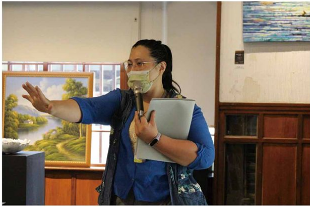
▲ 臺南愛國婦人會館導覽