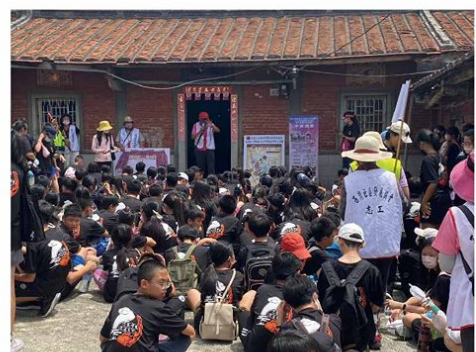
▲辦理大灣國小應屆畢業生社區巡禮暨定點導覽員及整體運作實務培力