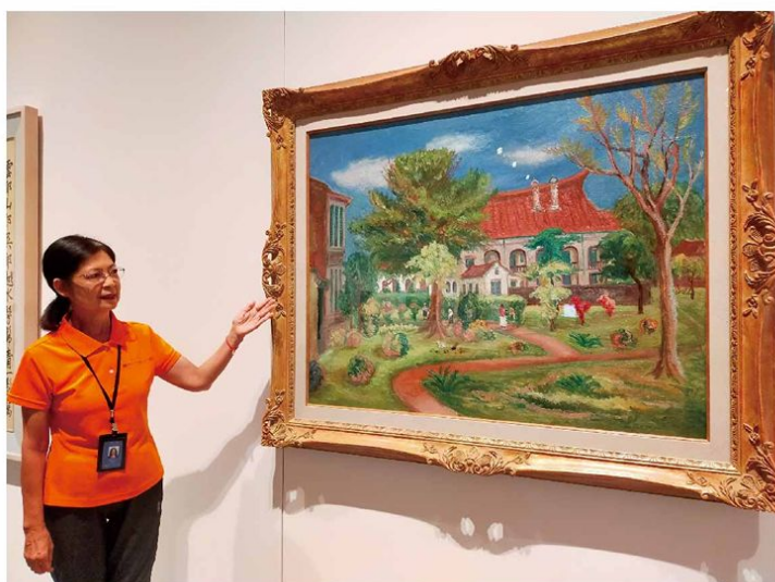
▲ 向民眾介紹展覽畫作

那是醫學院急診的一個夜晚，病患幾乎塞滿整個空間，沒病床的只能坐在廊道的椅子上靜候診療，但室內恆低的溫度，讓我在漫長的等待中倍覺寒涼，我懇請護理師給我一床棉被，她滿心答應，卻無法停下手邊的工作去取，又過了半小時之後，我實在難以抵擋身上陣陣冰涼的感覺。出於身為志工的基本反應，我去找了急診室的志工大哥拿了棉被，但就在我轉身之際，看見一位照顧先生的老太太縮在一隅瑟瑟而抖，於是我將手中的棉被給了她，在她不斷地感謝聲中，志工大哥也注意到了，二分鐘後，他主動送來另一條棉被給我；如果說我對志工精神的堅信，得到了暖心的對待，那麼，這種服務詮釋了甚麼？