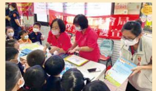
志工隊參與社區里長座談及大型活動，透過設攤宣導家庭暴力防治、兒童及少年保護、性侵害防治、性騷擾防治，讓防暴觀念更加落實