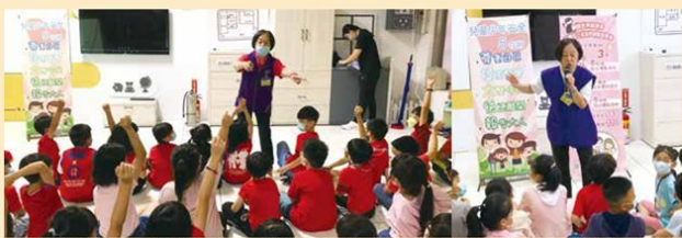
暑假期間結合消防局防災教育館，與兒童少年以團體互動方式帶入預防兒少遭受性侵害及虐待等自我保護方法

志工每週要服務 3 小時，除此之外還要參加防治宣導組、關懷組，當時政府正提倡『113 保護專線』，能讓受暴者有管道尋求協助，為了要把這服務告知全民，我們積極的在社區設攤宣導，並到學校和小朋友互動，教導如何保護自己，考慮到小朋友的理解能力，所以就演短劇的方式，這對我又是一個挑戰，還好有夥伴的引導及鼓勵，就這樣