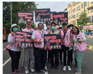
101 年臺南國慶焰火暨綠色消費環保集點推廣

年主動參與台南大學舉辦環境教育人員訓練，順利取得環保署環境教育人員認證，讓我的環境教育志工旅途變得更加寬廣，也讓我更有信心參與其他不同領域的志工服務，希望讓自己變得更好的同時，也帶動更多人共同來參與，將環境教育深耕在每個人心中。