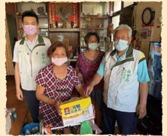
睦鄰志工提供物資給獨居長輩

儘管行動不便，一見到我們的到訪都喜孜孜地扶著四腳拐上門迎接，嘴裡總對我們說著「不用這麼客氣啦」、「不用特地來啦」...等，但獨居老人還是滔滔不絕的說著自己的心情和故事，說到子女的部分總是潸然落淚，不管獨居老人獨居的原因為何，總是很喜歡和我們說話訴說心情，也許是因為我的年紀和社區的獨居老人差不多，所以對他們表達的話語多少都能夠理解，甚至產生共鳴，彷彿與獨居老人一起參與了他們的人生故事，才知道原來獨居老人是很迫切的希望有人關懷，也讓我更願意和樂意投入這樣的志願服務。