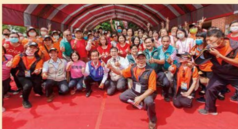
111 志工大會師 - 志趣相投嘉年華 - 市長與社會局長和志工團大合照

為整合本市公益服務志工人力資源，建置公益服務的人力資源平台，使更多有需求之弱勢市民，可得到關懷照顧及保護性服務，以及創造正向與公益向善的社會，結合社會局長期照顧管理中心、社會工作及家庭福利科及家庭暴力暨性侵害防治中心等三個單位所屬