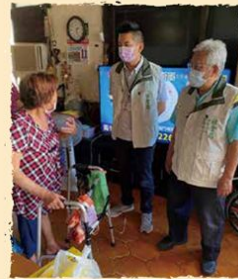
睦鄰志工提供居家服務、連結社會福利資源諮詢等

就在實際接觸社區中其他獨居老人後發現，原來獨居老人都很希望被人「打擾」，原本沒落的神情頓時出現光芒，