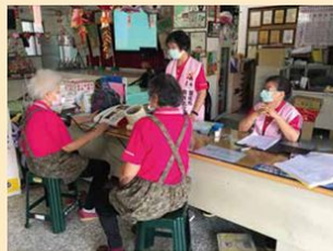
據點提供館室服務