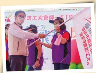
111 志工大會師 - 志趣相投嘉年華 - 市長授旗給福企志工總隊 安全守護志工大隊

期許能夠落實黃偉哲市長「以老服老」、「希望家園」之施政理念，並落實志工大臺南的服務願景，也同時號召更多的市民朋友一同加入志願服務的行列。