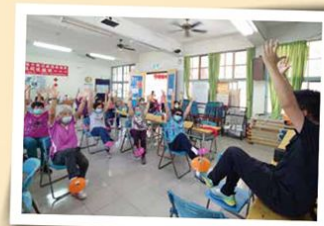
鼓勵家庭照顧者至據點參與活動

線發現照顧者的照顧負荷，同時也可以協助家庭照顧者進一步連結長照服務，鼓勵家照者一同參與據點活動，共同攜手合作，讓家照者不僅照顧家人也能疼惜自己，形成正向照顧循環，創造雙贏的照顧友善環境，逐步將臺南市打造為在地共老、共好的溫暖好所在。