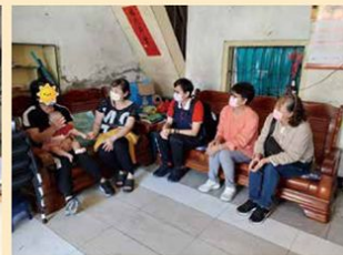
到宅關懷支持家庭照顧者

臺南市陪伴志工大隊目前由8大家庭照顧者支持據點分區組織8支志工中隊，再結合各行政區關懷據點志工小隊，組成陪伴志工隊。主要針對有服務需求之家庭照顧者提供關懷訪視、電話問安及鼓勵參與活動，提供被照顧者安全看視及陪伴，減輕照顧者的照顧壓力，協助照顧者連結長照服務網絡。