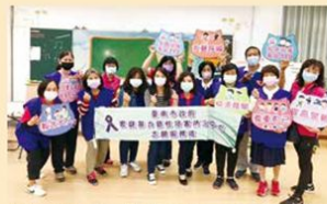
「志工媽媽-兒少保護行動劇團」深入校園，於學校朝會或晨光時間宣導虐童零容忍，讓兒童學習自我保護方法，並藉由互動模式，達到預防重於治療之功效