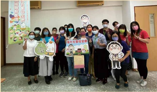
與睦鄰志工網路聯繫會議合照(玉井)，討論獨老配對議題

曾經的我擔任多年義交協助警方處理許多交通事故和受傷的民眾，漸漸發現不管在哪都有很多需要受幫助的人，看見他(她)們那種慌張無助的表情，令人不捨，因此不論颳風下雨，只要想到還有可能會有許多需要幫助的民眾，都會讓我願意堅持在志願服務的崗位中，持續盡一份自己的心力。