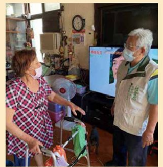
睦鄰志工定期關懷訪視，向獨居長輩嘘寒問暖

心和照顧，但也因為他們讓我更肯定自己的付出是有價值和意義的，希望可以持續這樣的服務，讓生活在社區的獨居長輩可以過得更溫暖、更安心。