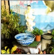
淨水定期換水 或保持流動

登革熱病媒蚊 - 埃及斑蚊、白線斑蚊幼蟲主要孳生於積水容器中，如水盆、花器、水盤等，治療期間請做好登革熱病媒蚊防治。