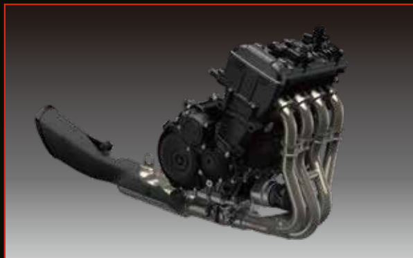
DOHC 並列四缸水冷引擎

DOHC引擎擁有絕佳的燃燒效率，能在動力與燃油排放間取得最佳平衡，實現低阻抗、高效率，於低轉速以及高轉速皆能輸出飽滿力道。