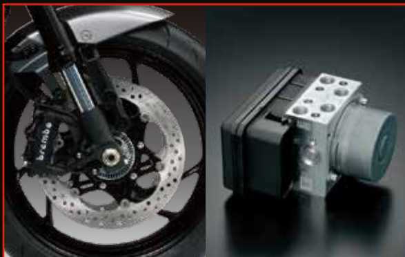
對向四活塞卡鉗+ABS剎車系統

DOHC引擎擁有絕佳的燃燒效率，能在動力與燃油排放間取得最佳平衡，實現低阻抗、高效率，於低轉速以及高轉速皆能輸出飽滿力道。