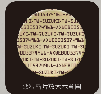
微粒晶片放大示意圖

SUZUKI重車採用與汽車同等級Data Dot微粒防竊辨識碼，運用高科技雷射精密顯微裝置，將車籍資料寫入在直徑小於1mm 2 的高分子化合物粒子上，並將3,000顆微粒子運用技術噴灑於車身任一細微處，使車身編號遍佈機車零件，讓竊賊難以處理，達到最有效的防盜措施。