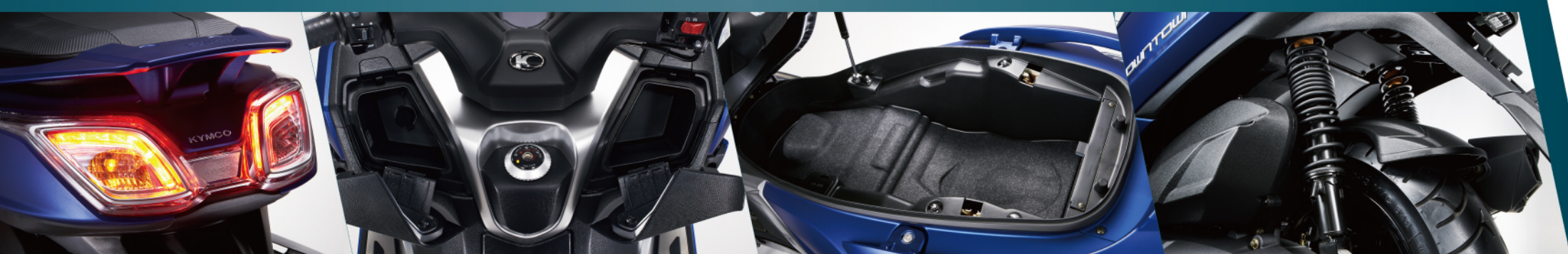
雙菱型分離光導式 LED 尾燈

使個人移動更為智慧，讓您在等紅燈時不再無聊。具有「時間、時速表、天氣、智慧羅盤、通知及尋車」滿足所有騎士旅程上的需求。