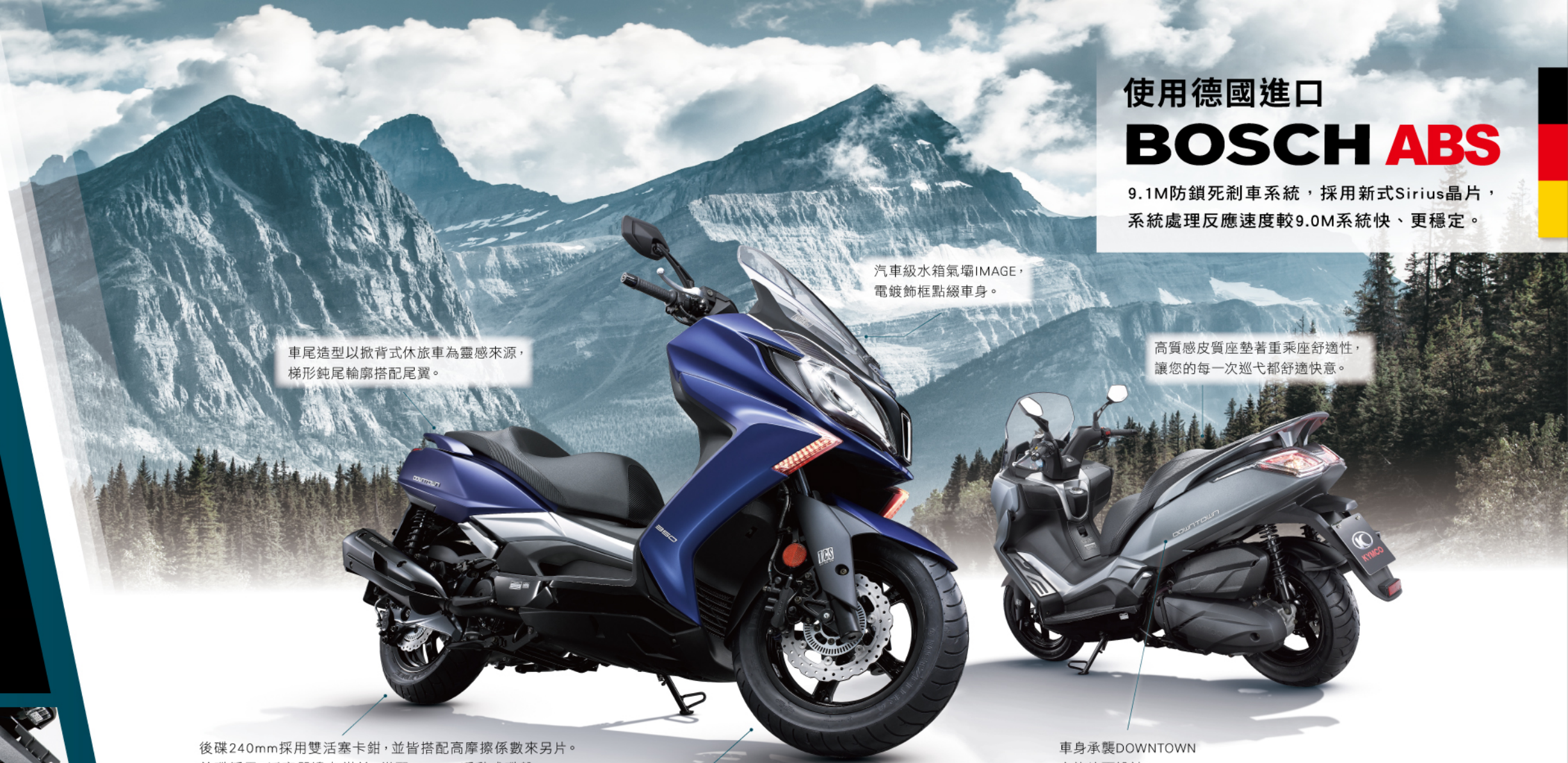
後避震器 5 段式調整雙避震器