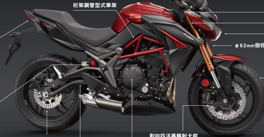
桁架鋼管型式車架