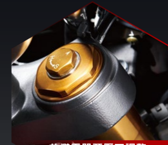
前避震器預壓可調整