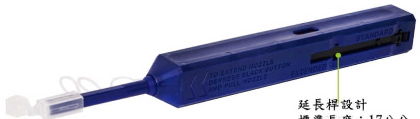
延長桿設計 標準長度：17公分 延長長度：21公分